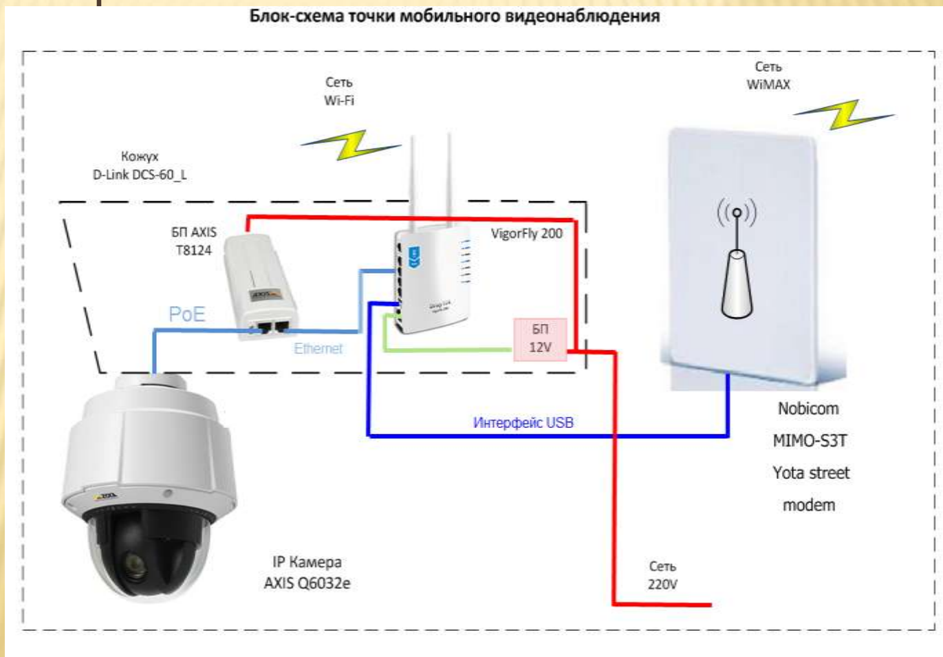
Блок-схема точки мобильного видеонаблюдения